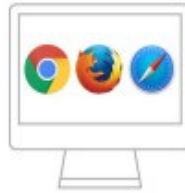
PC and Mac Chrome | Firefox | Safari